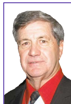
Claude Touchette Cérémoniaire d'État