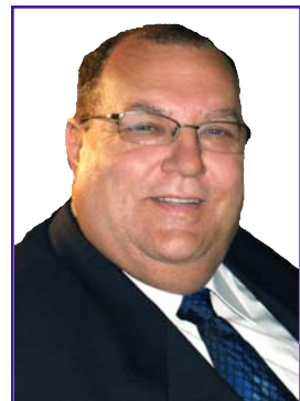
Pierre Beaucage Député d'État